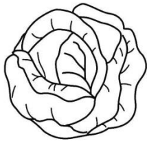
Квашена капуста білокачана

Корисні тим, що містять вітаміни С, Е, Р, РР, групи В — В р В 2 , В 5 , В 6 , В 9 , а також такі вітаміноподібні речовини, як інозитом. Регулярне вживання цитрусових або соку з них дає змогу запобігти захворюванню на гострі респіраторні вірусні інфекції.